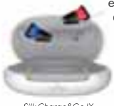
Silk Charge&Go IX

Das muss gar nicht sein. Denn heutzutage haben Hörgeräte nichts mehr mit den klöbigen Hörhilfen von früher zu tun. Längst sind sie zu wahren Wunderwerken in Miniaturform geworden. Eines der kleinsten auf dem Markt ist das Silk von Signia. Jetzt bringt der Erlanger Hörgerätehersteller eine neue Generation des Silk heraus, die noch näher an dem dran ist, woran wir uns mittlerweile bei elektronischen Geräten gewöhnt haben: Einfaches Aufladen statt umständlichem Batteriewechsel. Denn mit Silk Charge&Go IX präsentiert Signia das Gerät auch als wiederaufladbare Akku-Variante.