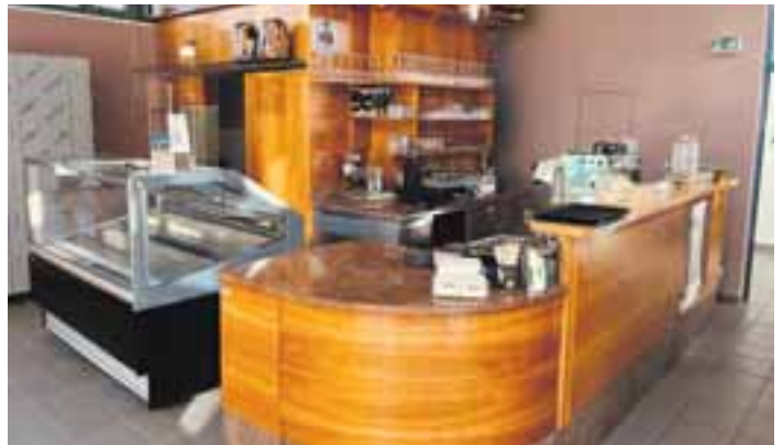
Die Theke ist schon geputzt. Ab Gründonnerstag soll es im Eiscafé am Kirchberg wieder Eis, Getränke und noch vieles mehr geben.