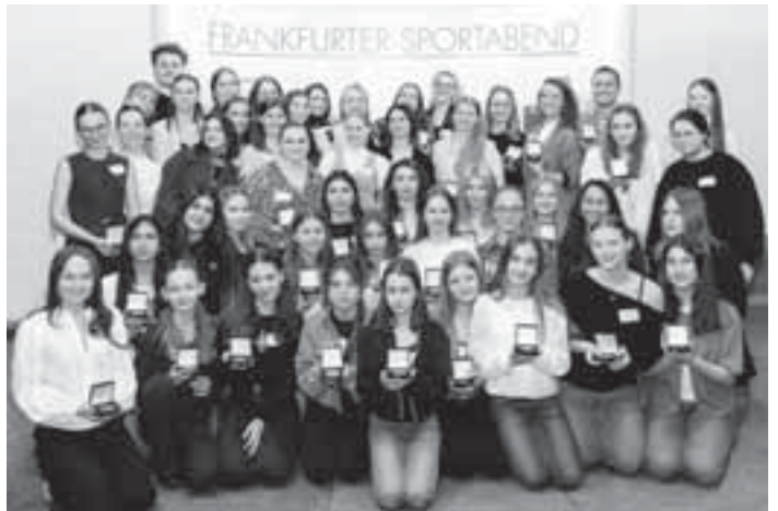
Beim Sportabend der Stadt Frankfurt wurden auch die sportlichen Leistungen der Turniergruppen des SGS-Tanzsport ausgezeichnet.

den. Ein besonderer Höhepunkt steht am 18. und 19. April an: Die SGS richtet ein Heimturnier in der Stadthalle Zeilsheim aus. Dabei sollen hochklassiger Tanzsport, emotionale Momente und beste Stimmung garantiert sein. Gleich fünf Formationen der SGS gehen an diesem Wochenende mit Heimvorteil auf die Turnierfläche. Weitere Informationen und Tickets gibt es unter sgs-tanzsport.de im Internet. red