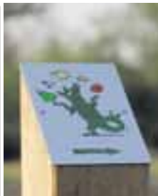
Der Sossheimer Obstpfad hat ein eigenes Symboltier bekommen.

Ein eigenes Grüngürtel-Tier hat der Sossheimer Obstpfad auch, das von Philip Waechter gezeichnet wurde. In der Broschüre sind damit die Naturerfahrungsangebote zum Mitmachen für Kinder gekennzeichnet. Und am Obstpfad findet sich auch komische Kunst: Die „Chlodwig-Poth-Anlage“,