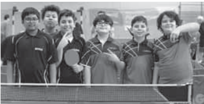
Obwohl sie erst seit kurzem Tischtennis spielen, haben sich die Nachwuchsspieler der SGS beim Kreisentscheid gut geschlagen.