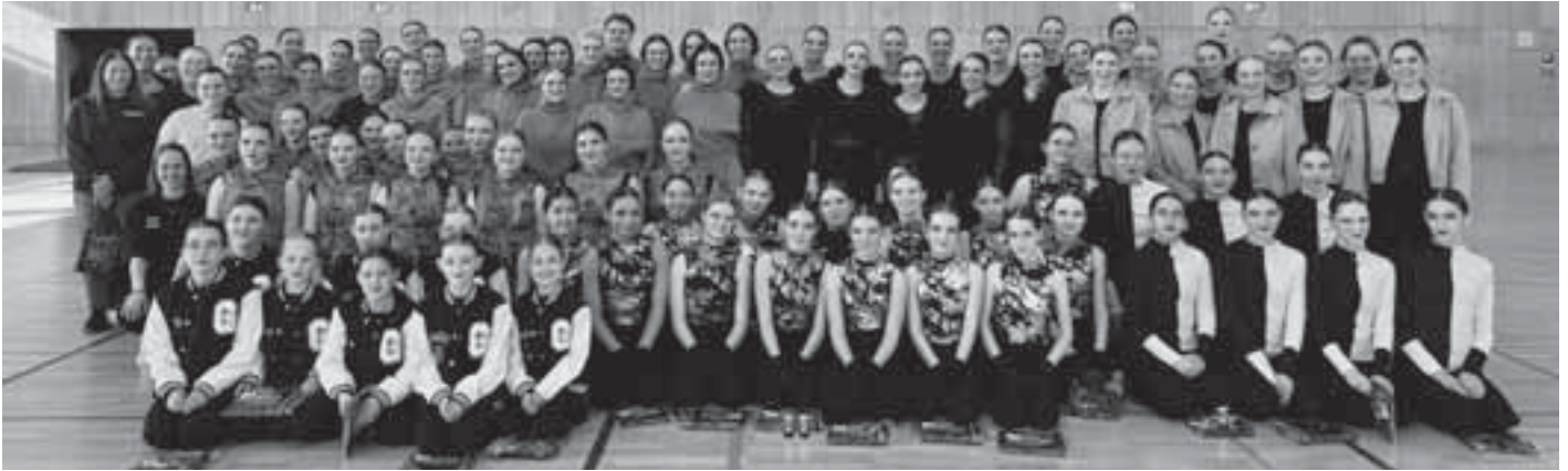
Bei der Saisonöffnung präsentierten acht Turniergruppen der Tanzabteilung der SGS ihre neuen Choreografien in der Stadthalle Zeilsheim.