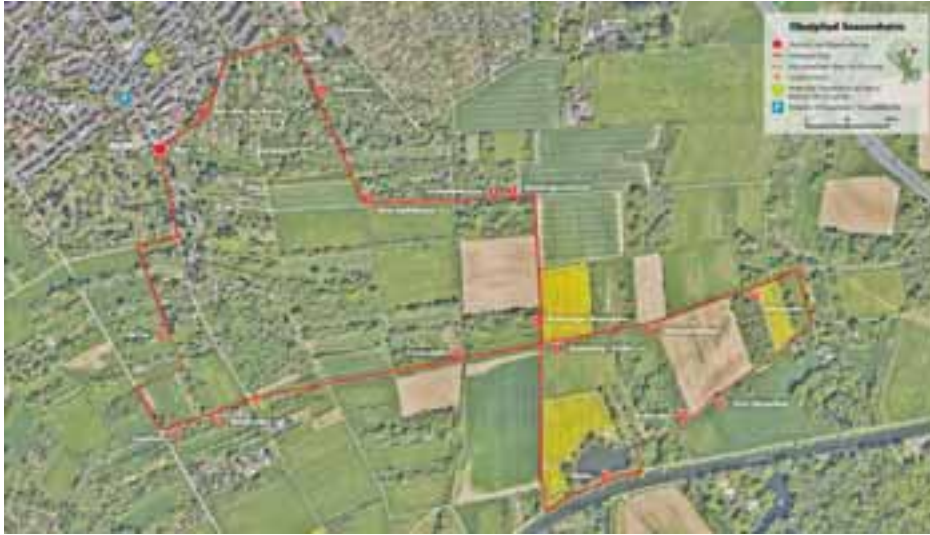
Viereinhalb Kilometer lang ist der Sossheimer Obstpfad, der zu 16 Stationen im Unterfeld führt. Grafik: Stadt Frankfurt